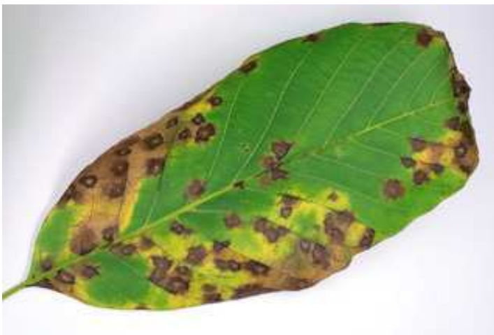
Ανθράκωση. Προσβολές σε φύλλο.