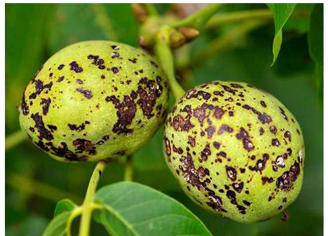
Ανθράκωση. Προσβολές σε καρπούς.

Πληροφορίες: Ν.Ι.Μπαγκής - Ε.Α.Αλατοσατιανός