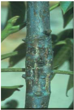
Προσβολή σε νεαρό βλαστό.