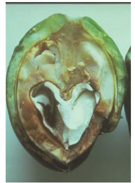
Μεταχρωματισμός της ψίχας.