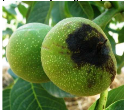
Προσβολή σε ανεπτυγμένο καρπό.